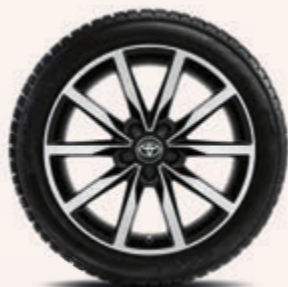
18-Zoll-Winterkomplettrad, schwarz frontpoliert