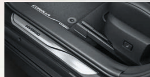
Einstiegsleisten Aluminium, vorne und hinten