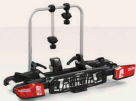
Heckfahrradträger Arimero 402 Geeignet für zwei Fahrräder