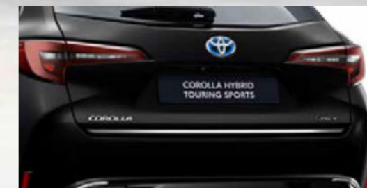
Untere Heckklappen-Zierleiste, verchromt (Corolla Touring Sports)