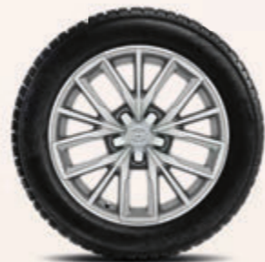
17-Zoll-Winterkomplettrad, silbern oder schwarz