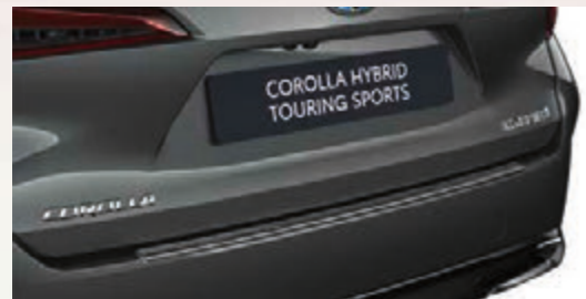
Ladekantenschutz, Edelstahl (Corolla Touring Sports)