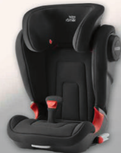
Kindersitz (Abbildung ähnlich)