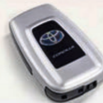
Smart Key Cover Mit Hybrid-Schriftzug