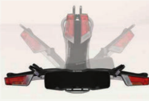
Thule Heckfahrradträger, faltbar