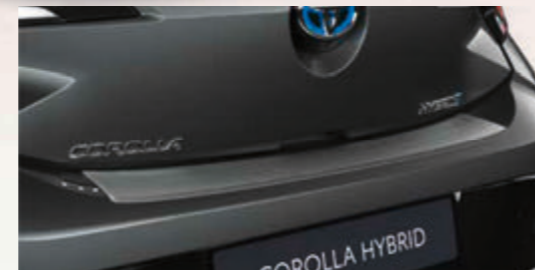
Ladekantenschutz, Edelstahl (5-Türer)