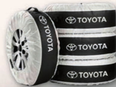
Reifensäcke Mit Toyota Schriftzug