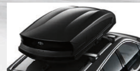
Dachbox mit Querträger (Corolla Touring Sports)