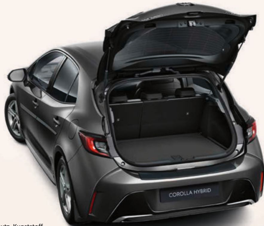
Ladekantenschutz, Kunststoff (5-Türer)

Design, Komfort und Sicherheit: Ihr Corolla glänzt bereits durch unvergleichliche Qualitäten. Dank Toyota Original-Zubehör Ihres Toyota Partners können Sie Ihren Corolla noch weiter perfektionieren, bis er Ihren Wünschen und Bedürfnissen exakt entspricht.