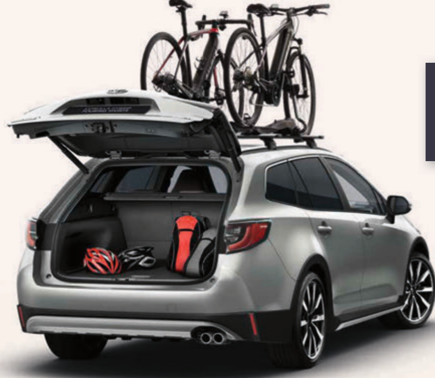
Fahrradträger ProRide (Abbildung ähnlich)

Weitere Informationen zu unserem TOYOTA ORIGINAL ZUBEHÖR finden Sie in unseren Preislisten oder auf toyota.de . Einfach den QR-Code scannen und Topangebote entdecken.