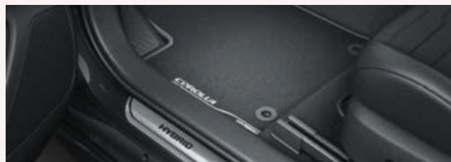
Fußmatten aus Velours