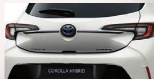
Obere Heckklappen-Zierleiste, verchromt (5-Türer)