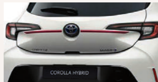
Obere Heckklappen-Zierleiste (5-Türer)