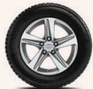
16-Zoll-Winterkomplettrad, silbern oder schwarz