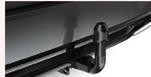
Anhängerzugvorrichtung (Corolla Touring Sports)