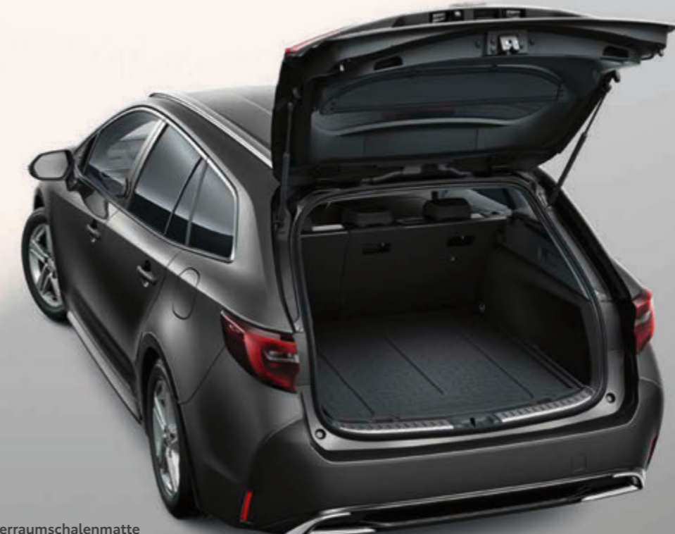
Kofferraumschalenmatte (Corolla Touring Sports)